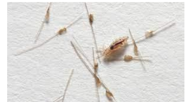
Kopflaus und deren Nissen

Wir bitten Sie, in den nächsten Tagen das Kratzverhalten Ihrer Kinder etwas genauer zu beobachten und unbedingt Meldung an die Schulleitung zu machen, sollten Sie entweder die Tierchen oder deren Eier (Niessen) entdecken. Wenn nötig, werde ich Lauskontrollen organisieren.